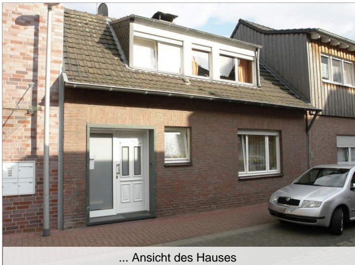
... Ansicht des Hauses