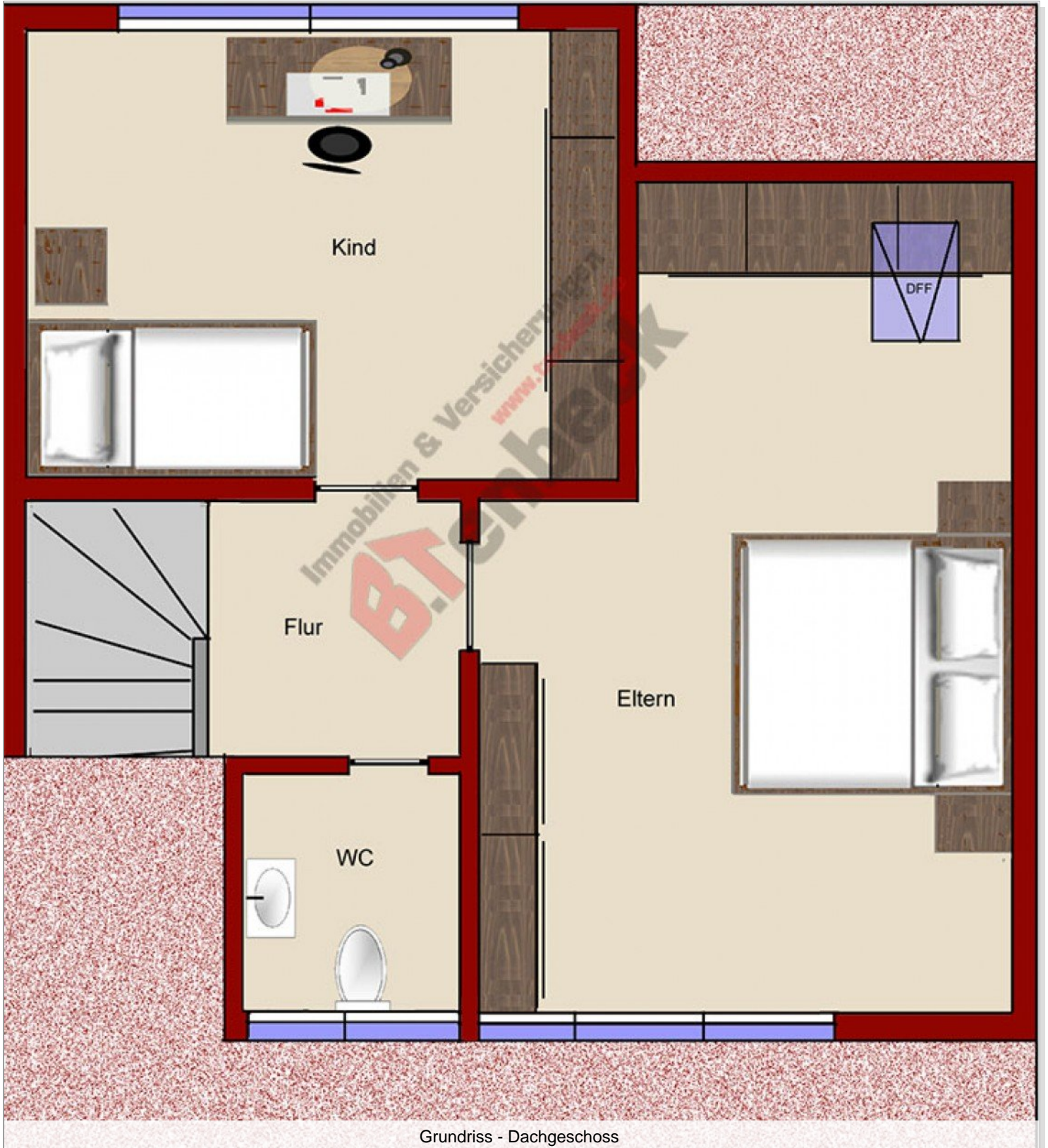
Grundriss - Dachgeschoss