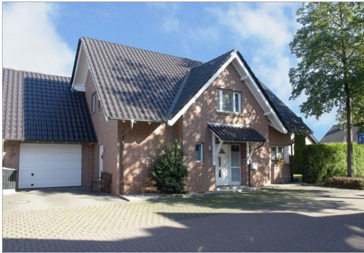
... Ansicht des Hauses