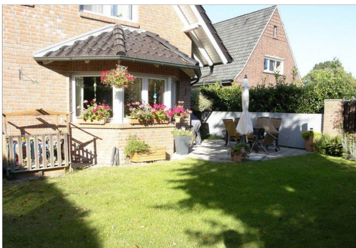
... Ansicht - Garten