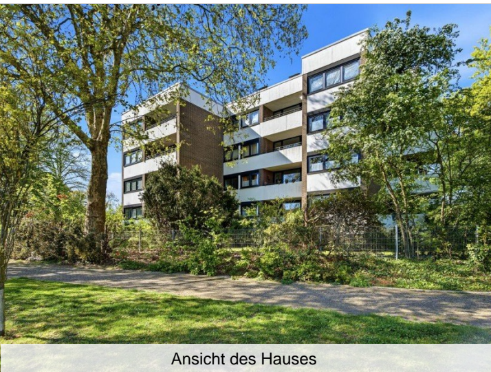
Ansicht des Hauses