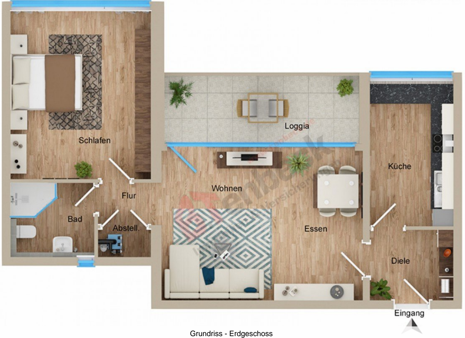
Grundriss - Erdgeschoss